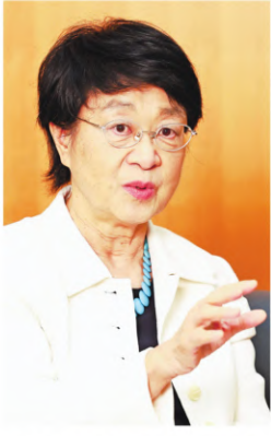
むかい・ちあき 昭和27年、群馬県生まれ。慶応大医学部卒業後、心臓外科医に。60年にアジア人初の女性宇宙飛行士に選ばれ、平成6年と10年にスペースシャトルに搭乗。27年に東京理科大学副学長、28年4月から現職。